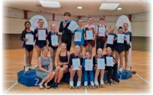
Hessischer Nachwuchs-Show-Wettbewerb (HNSW), Darmstadt