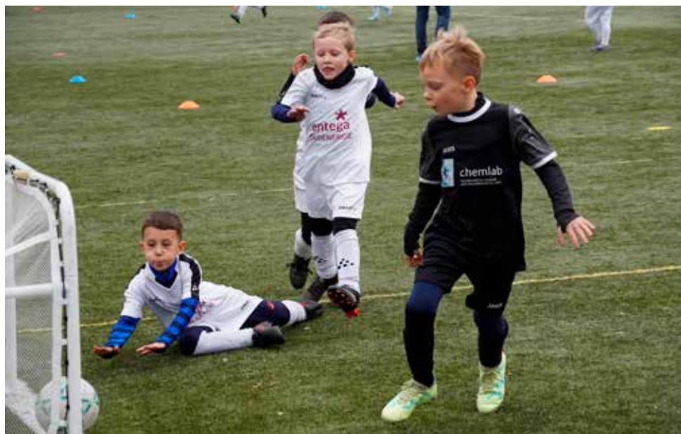
Tor für die KSG – beim Spielfest für G-Junioren am 15. 11. in Groß-Bieberau.