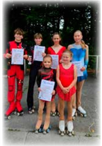
Brüder Grimm Pokal, Hanau